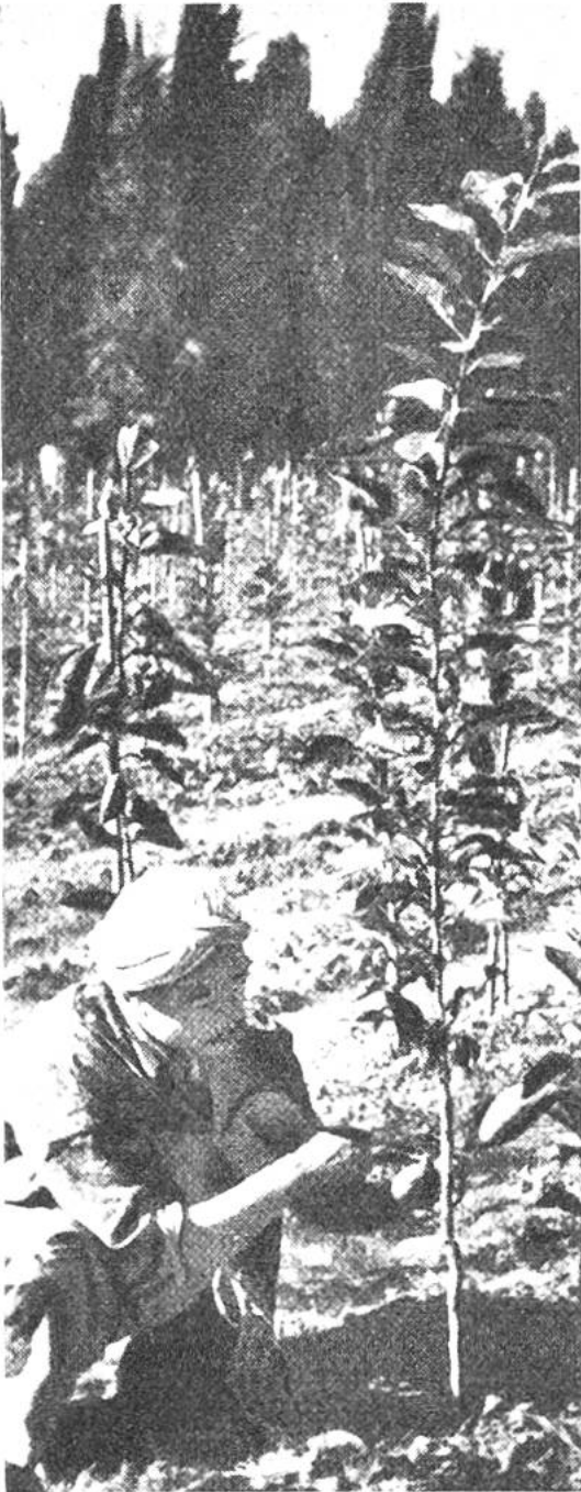
Veredelung junger Orangenbäumchen in einem nordafrikanischen Kolonialbetrieb.

Die zur Familie der Rautengewächse gehörenden Citrussträucher sind mit immergrünen Blättern, wohlriechenden Blüten von weisser bis rötlicher Farbe und runden oder länglichen, nuss- bis kopfgrossen Beerenfrüchten behangen. Die Fruchtschale ist reich an mit ätherischem Öl gefüllten Drüsen. Unter der Schale liegt eine weissliche, schwammige Schicht, welche die keilförmigen, saftreichen „Schnitze“, in denen wenige Samen sitzen, umhüllt.