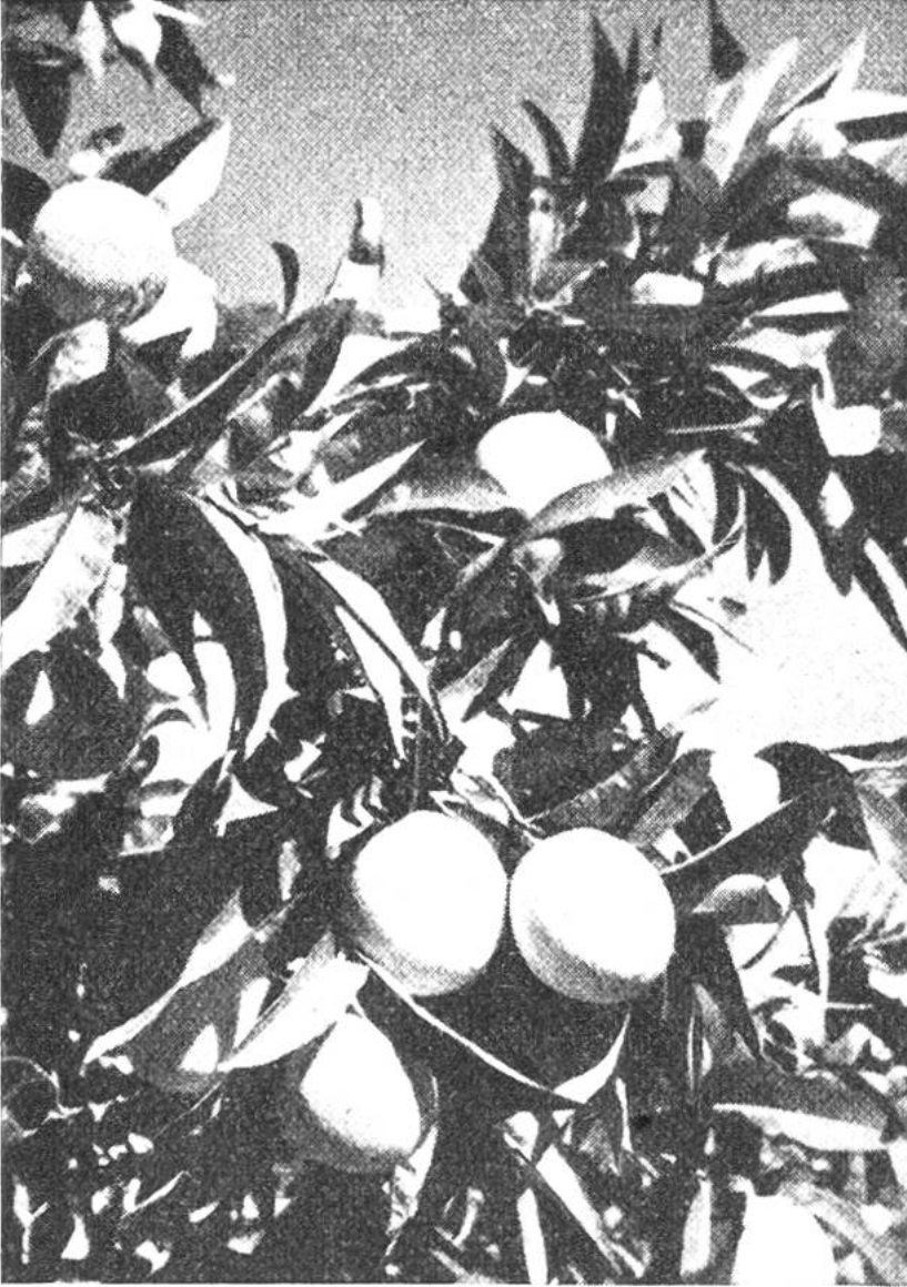
Erntereife Orangen in Nordafrika.