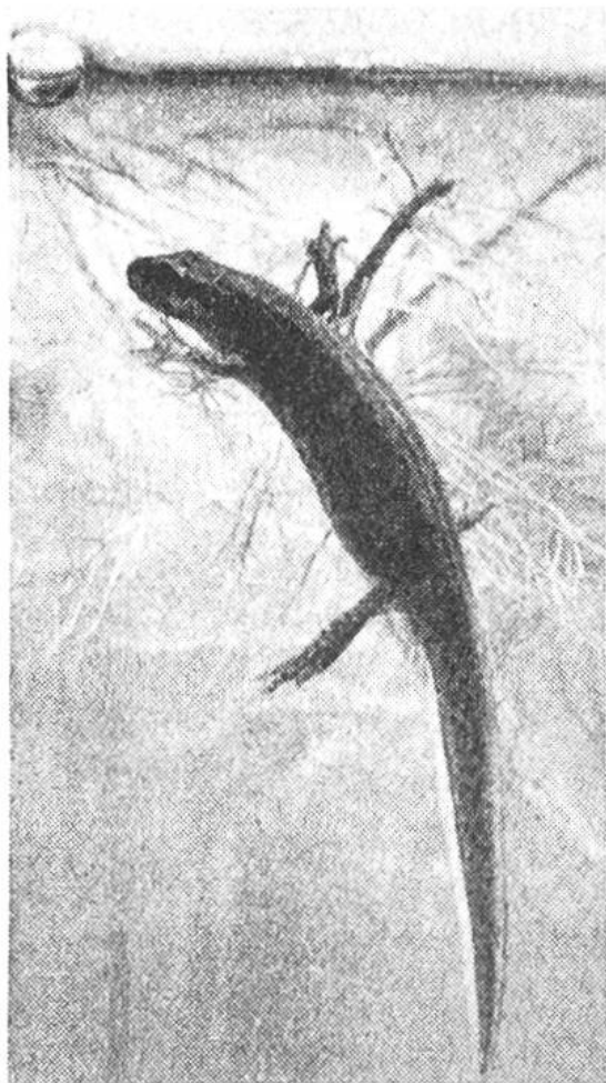
Teichmolche sind dankbare und ausdauernde Aquarienbewohner; sie lassen sich selbst in kleinen Gläsern gut halten.

Sicher wirst du einmal auch einen kleinen Wasserskorpion im Netz finden. Mit seinem schnabelartigen Mundwerkzeug kann er in den Finger stechen, wenn man ihn etwas unvorsichtig berührt. Gefährlich aber ist das Tierchen nicht. Beobachte, wie der Wasserskorpion mit seiner langen Atemröhre atmet, wenn er an die Wasseroberfläche kommt. Füttere das Tier mit Fliegen und Würmern. Vielleicht hast du sogar das Glück, einen grossen Kolbenwasserkäfer oder seine Larve zu finden. Die Tiere nähren sich von Pflanzenteilen und sind harmlos, die Larve aber lebt räuberisch. Du musst sie allein in einem Glase halten. Viel häufiger ist der Gelbrandkäfer. Man erkennt ihn an dem gelben Rand, der seinen ganzen Rücken säumt. Setze ihn ja nicht zu an-