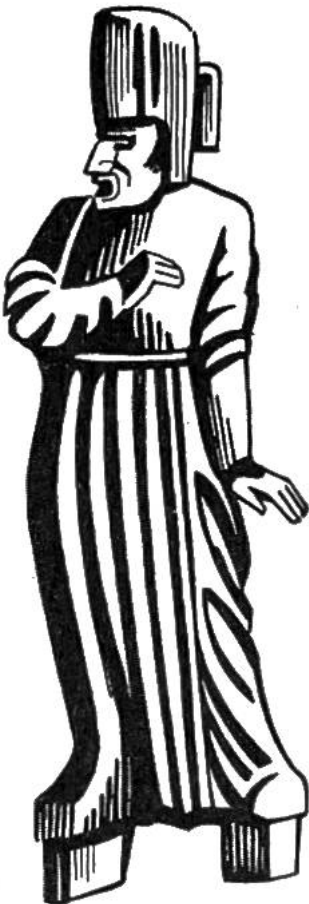
Römischer Schauspieler (nach einer Plastik).

Wir kennen die griechischen und römischen Theaterbauten aus ihren Überresten und wissen, wie dort gespielt wurde. Auch was dort gespielt wurde, ist uns in zahlreichen Dramen überliefert. Mit abschreckenden oder erhebenden Beispielen gedachten die Dichter ihr Publikum vor dem Bösen zu bewahren und zum Guten hinzuführen. Ein Chor sprach die verbindenden Worte und nahm für oder wider die Darsteller Partei.