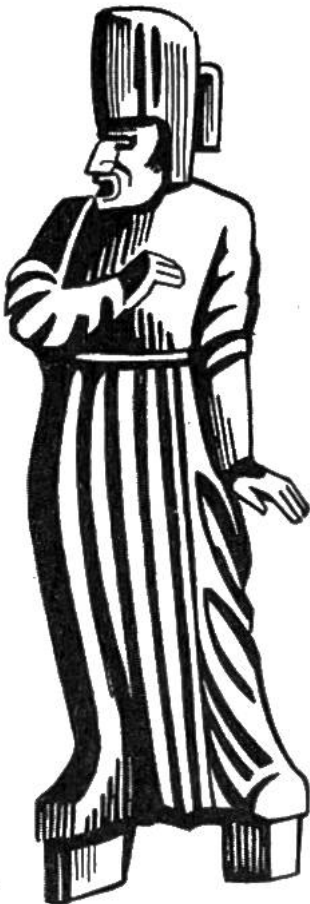
Römischer Schauspieler (nach einer Plastik).

Wir kennen die griechischen und römischen Theaterbauten aus ihren Überresten und wissen, wie dort gespielt wurde. Auch was dort gespielt wurde, ist uns in zahlreichen Dramen überliefert. Mit abschreckenden oder erhebenden Beispielen gedachten die Dichter ihr Publikum vor dem Bösen zu bewahren und zum Guten hinzuführen. Ein Chor sprach die verbindenden Worte und nahm für oder wider die Darsteller Partei.