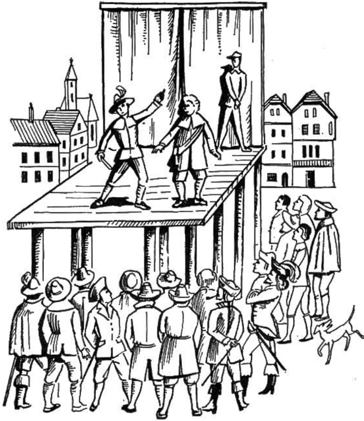
Wandertruppe der Molière-Zeit (Mitte 17. Jahrhundert).

Heiligen aufgeführt. Dies geschah meist vor den Kirchenportalen, auch in den Kirchen selbst oder auf Plätzen, über welche Szene für Szene auf nacheinander heranfahrenden Bühnenwagen gespielt wurde.