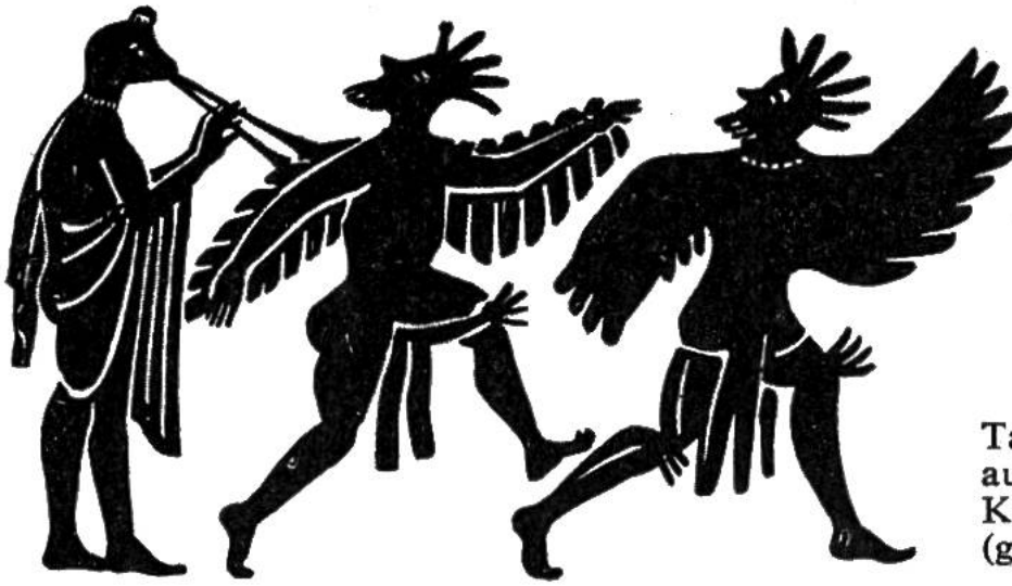
Tanz des Vogelchores aus Aristophanes' Komödie «Die Vögel» (griech. Vasenbild).