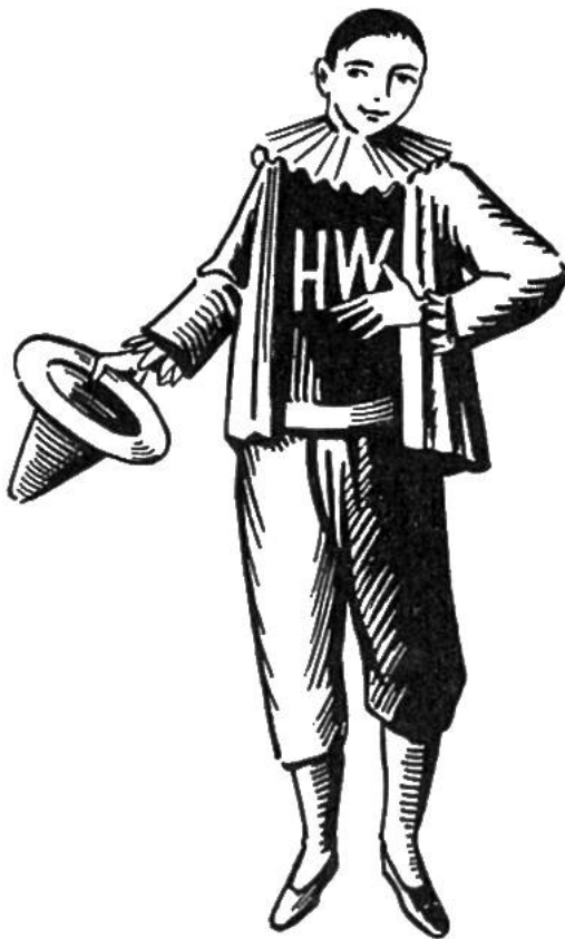
Hans Wurst, 17. Jahrhundert.

Auf griechischen Vasen finden wir Schauspieler dargestellt, die in Kostüm und Maske eindrucksvoll auf hohen Sohlen, dem Kothurn, übermenschengross einherschreiten.