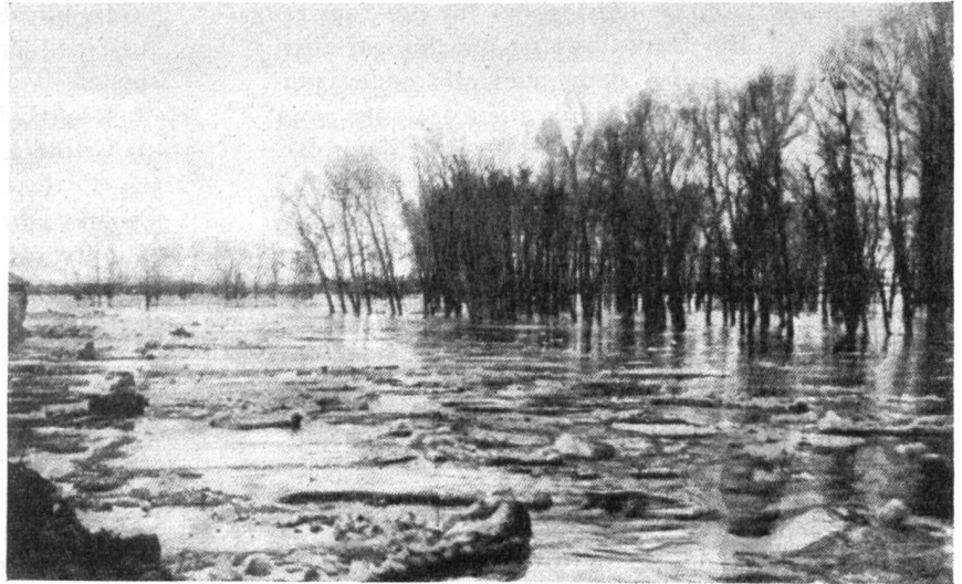
Abb. 1. Frühjahrsüberschwemmung des Uralflusses bei Orks.