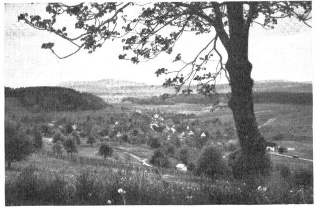
Das Bild einer Ortschaft, die sich harmonisch in die Landschaft einfügt. Störende Ueberbauungen fehlen. Eine bereits durchgeführte Güterzusammenlegung hat vom offenen Land her die Voraussetzung geschaffen, dass sich die Ortschaft auch künftighin gesund entwickeln kann.

Neben den augenfälligen Merkmalen einer durchgeführten Güterzusammenlegung gibt es noch zahlreiche Auswirkungen, die zwar versteckter liegen, deshalb aber nicht minder wichtig sind. So erlaubt der angesiedelte Bauernhof dem Landwirt nicht nur eine rationellere Bewirtschaftung seines Bodens, er entlastet die Strassen auch vom landwirtschaftlichen Verkehr und die Ortschaft von Gewerben, die standortsmässig falsch liegen. Die richtige Lage der Felder zu den Hauptstrassen erleichtert nicht nur dem Bauern die Arbeit, sie befreit auch den schnellen Durchgangsverkehr vom gefährlichen landwirtschaftlichen Querverkehr. Die Begrenzung des Baulandes von Seite der Ortschaft wie auch vom landwirtschaftlichen Gebiet her schafft rechtlich eine haltbarere Grundlage und damit auch die Voraussetzung, dass die Begrenzung nicht nur auf dem Papier stehen bleibt. In aller Stille beginnt sich hier Planungsarbeit auszuwirken, und sie ist ein Beweis mehr, dass sich die Planung auf die Dauer lohnt. Ar.