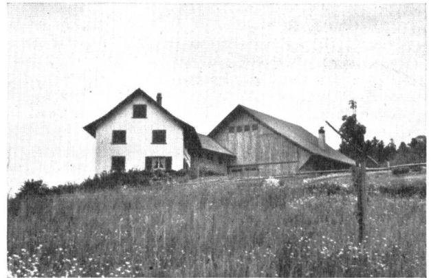
Ein angesiedelter Bauernhof, inmitten des zugehörigen Kulturlandes, mit einer Güterstrasse bequem an die Ortschaft angeschlossen. Eine der vielen, positiven Auswirkungen der Güterzusammenlegung zur Pflege und Erhaltung eines gesunden Bauernstandes.