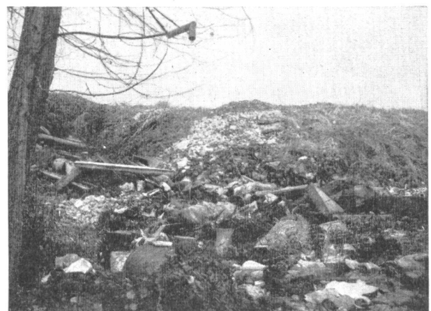
Abb. 1. Zum Artikel Brodbeck (auf folgender Seite). — Auf Schritt und Tritt begegnet der Spaziergänger, der die Umgebung unserer Ortschaften durchwandert, diesen hässlichen Zeichen ungeordneter Abfallbeseitigung. Kessel, Känel, Büchsen, Geschirrscherben, zerbrochene Flaschen und Krüge und sogar ganze Matratzen «zieren» die Borde unserer Spazierwege. Statt zu einer Quelle der Erholung werden so unsere lieblichen Landschaften derart verschandelt, dass sie ihren Besuchern beständig Anlass zu Aergernis geben. Aber nicht nur das Auge wird durch den Anblick dieser hässlichen Abraumhaufen beleidigt, nein, auch die Nase des Spaziergängers bekommt genug von den oft Ekel und Uebelkeit erregenden Gerüchen, die diesen Ablagerungen des «technischen Fortschrittes» entströmen.

Dans les communes de faible étendue, les difficultés de l'enlèvement des ordures ne sont pas d'ordre technique, mais dépendent de la politique locale. Lorsque des autorités conscientes de leurs responsabilités sont décidées à résoudre un problème, au lieu d'avoir des égards injustifiés qui mènent à tolérer simplement certaines insuffisances, elles peuvent toujours réaliser un enlèvement des ordures ménagères à la fois économique et répondant aux exigences d'une protection efficace des eaux. Ainsi, plusieurs communes petites ou moyennes peuvent organiser entre elles un service commun d'enlèvement, pour autant qu'elles disposent de moyens de traction appropriés, tels qu'on les rencontre dans les villes. Dans la région de Bâle, par exemple, il existe une entreprise d'enlèvement qui, à la satisfaction de tous les intéressés, dessert les communes de Bottmingen, Münchenstein, Muttenz, Pratteln, Frenkendorf et Sissach; les ordures y sont recueillies une ou deux fois par semaine et régulièrement amenées aux installations d'incinération de Bâle.