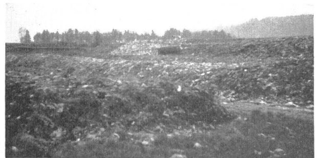
Abb. 6. Kompost-Mieten im landwirtschaftlichen Betrieb «Paradies» bei Schaffhausen. Verwertung des Kehrichts mit Erfolg. Anlage ganz einfach zu bedienen.