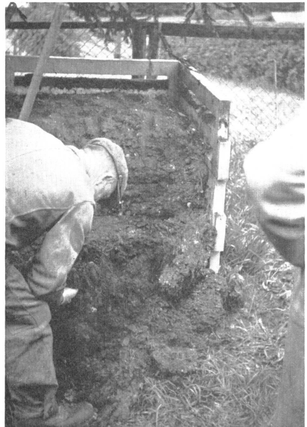
Abb. 5. Rippa-Silo für Kompostierung nicht zerkleinerten Rechengutes aus der Kläranlage St. Gallen. Oeffnung, vollständige Verrottung des sehr komplexen Rechengutes.

Es sei eingestanden, dass noch viel Arbeit zu leisten ist, bis die besten Lösungen für jeden Fall gefunden sind. So ist zwar der beschriebene Vorgang der Kehricht-Frischschlammkompostierung bis zum einwandfreien Endeffekt im Handbetrieb gut durchführbar, doch ist dies unästhetisch und infolge der