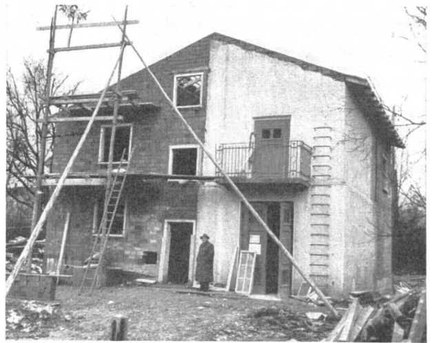
Abb. 2. Die Turmstation wandelt sich zum Zweifamilienhaus. Rechts die Ueberreste der Station, links der angebaute Wohnteil.

Schaltanlagen von 8000 Volt und von 16 000 Volt aufweisen. Die alte Turmstation steht in einem vorwiegend mit Einfamilienhäusern überbauten Wohngebiete und hat sich wie Abbildung 1 zeigt, sehr unschön in der Gegend ausgenommen.