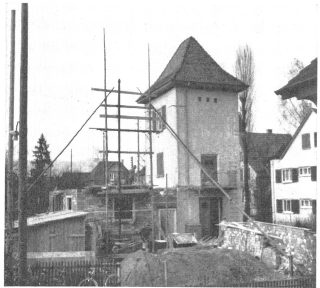
Abb. 1. Die alte Turmstation war ein Fremdkörper im Quartierbild.

Durch die fortwährende Belastungszunahme ist das Elektrizitätswerk Aarau gezwungen, seine Transformatorstation Bergstrasse teilweise von der normalen Verteilanlage für die Stadt mit 8000 Volt auf 16 000 Volt umzubauen. Diese Spannungserhöhung erfordert auch die Vergrösserung der Räumlichkeiten. Die gleiche Station wird also