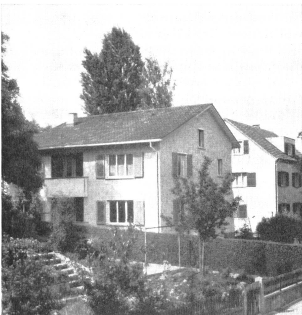
Abb. 5. Der Umbau ist vollendet. Nur der Eingeweihte weiss, dass das Gebäude eine Transformatorstation birgt.

Bei Landankäufen achtet das Elektrizitätswerk ganz besonders darauf, dass es nicht nur den kleinen Raum für die Transformatorstation, sondern auch etwas Umschwung erwirbt. Es lassen sich dadurch später eventuelle Erweiterungen ohne Schwierigkeiten lösen.