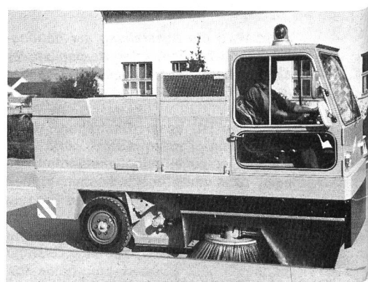
Abb. 1. Vollhydraulische Kehrmaschine Tecko, Modell SAM 2000. Kehrbreite einstellbar von 1600 bis 2100 mm, Kehrleistung bis 20 000 m 2 /h, Aufnahmevolumen 1500 l, Auskipphöhe des Schmutzbehälters 1320 mm (Generalvertretung für die Schweiz: Robert Aebi AG)

die Zapfwellen vorn und hinten sowie über eine zusätzliche Wegzapfwelle für Triebanhänger können jede Art von Schneeräumungsmaschinen, Kehrbesen, Schwemmeinrichtungen oder Wegbaugeräten betrieben werden. Zwei be-