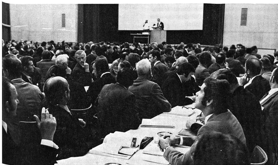
Die Tagung begegnete einem ausserordentlich grossen Interesse, wie übrigens auch die Fachausstellung