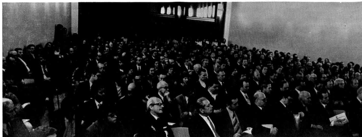
Abb. 2. Die Grndungsversammlung vom 8. Februar 1973 in Vaduz

lassen und ber das Arbeitsprogramm der Gesellschaft fr Umweltschutz zu beraten. Einen besonderen Akzent erhielt die Grndungsversammlung vom 8. Februar durch die Anwesenheit des Landesfrsten Franz Josef II., der damit einmal mehr sein Interesse an den aktuellen Problemen des Landes bekundet hat.