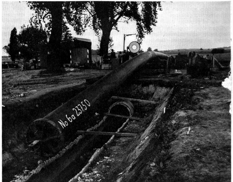
Abb. 1. Ueber ein Rollenlager, das die Reibung herabsetzt, werden die Rohre in den auf einer Strecke von 50 m aufgebrochenen alten Kanal (Mitte unten) eingezogen. Eine Grosswinde am Altrhein, wo der Kanal mündet, zieht die Rohre mittels eines Drahtseils (links unten) durch. Links zwischen den Bäumen ist das Zelt, das für das Schweissen nötig war, zu erkennen. Nur für Demonstrationszwecke hat man die Schweissanlage ins Freie gebracht und links neben dem Rohr aufgebaut

Durch die starke Bevölkerungszunahme in diesem Gebiet und die damit verbundenen