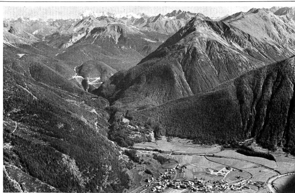
Der Schweizerische Bund für Naturschutz hat an der Delegiertenversammlung in Zug beschlossen, den Nationalpark in eine öffentlich-rechtliche Stiftung umzuwandeln. Wenn diese Zielsetzung verwirklicht werden kann, will der SBN seinen Nationalparkfonds von 1,2 Mio Fr. dieser Stiftung übertragen und auch weiterhin grosse Kostenanteile übernehmen. Unser Flugbild zeigt Zernez im Vordergrund mit dem Nationalpark

Extensivierung der Produktion und damit mit einem relativ geringeren Angebot zu rechnen. Längerfristig lässt sich allerdings wenig aussagen.