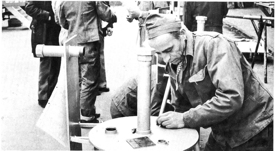
▲ Wird die Arbeit der Prüfung des Experten standhalten?