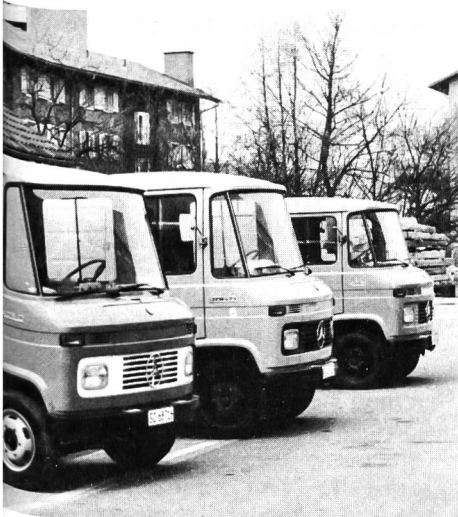
▲ In Reih und Glied