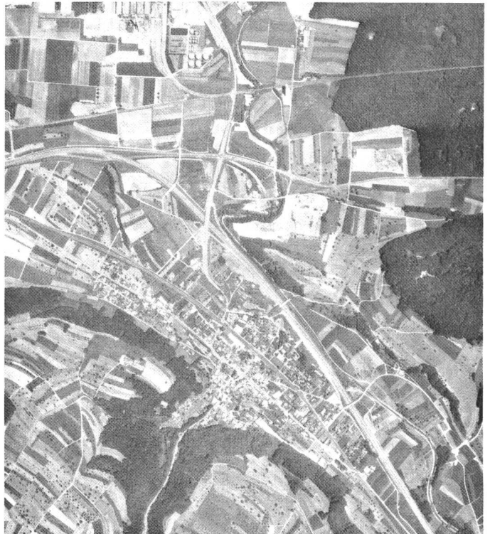
Industrianlagen und grosse Kiesgruben sind in den ehemaligen Streifengewannen entstanden. Die gebietsweise durchgeführte Güterzusammenlegung hat die alte Parzellierung aufgehoben. Die beiden Aufnahmen stammen aus den Jahren 1953 bzw. 1978.