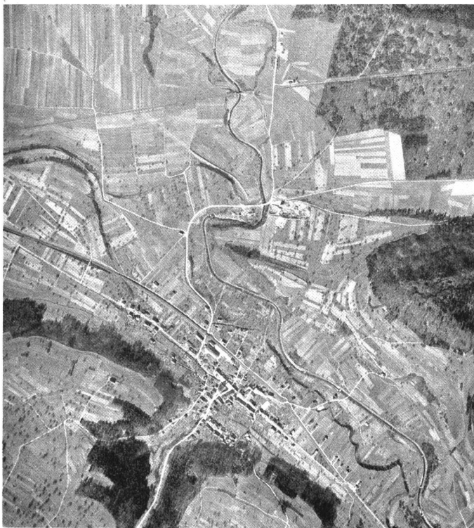
Die Abbildungen aus der Umgebung von Eiken belegen die Umgestaltung einer Landschaft durch den Nationalstrassenbau und die ihn begleitenden und die ihm folgenden baulichen Massnahmen. So wurde die Sissle teilweise verlegt, und die durch sie geschaffenen Formen und deren Vegetation wurden weitgehend beseitigt.