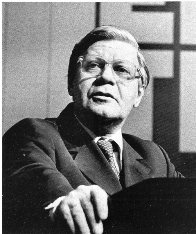
Der Bundeskanzler während seiner Eröffnungsrede, die eine gute Stunde dauerte und in der Tagespresse grosse Aufmerksamkeit fand, weil er sich in Widerspruch mit namhaften Politikern seiner Partei klar für Kernenergie aussprach und forderte, dass die Ökologie mehr Rücksicht auf das wirtschaftlich Machbare nimmt.

Der «plan» war auch dabei und konnte sich selbst überzeugen, dass die schweizerische Industrie im Bereich Umwelttechnik Spitzenleistungen und -produkte anbieten kann. Folgende Stände haben uns besonders beeindruckt: BCS Bauconsult System, Gebr. Bühler, Ciba-Geigy, Elektrowatt, Kontron, Luwa, Maschinenfabrik Meyer in Deitingen, Novasina, Ofag, Polyme-