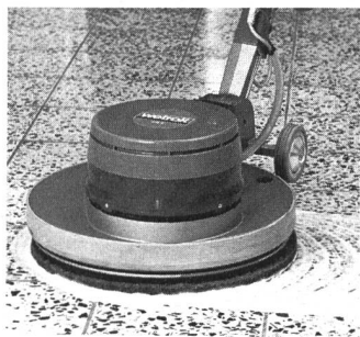
Bodenreinigungsmaschine Wetrok-Servomat 415E beim Fegen mit Wetrok-Autiwax.

genannten Faktoren unter «einen Hut» zu bringen. Als Resultat der Bemühungen können, ohne Abstriche an den Sauberkeitsgrad machen zu müssen, vielfach Einsparungen bis zu 25% und mehr erzielt werden.