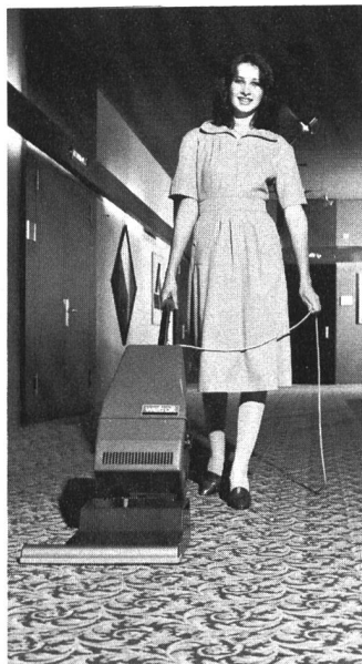
Tiefsaug- und Florbürstmaschine Wetrok-Karpawel.

Die Betriebsreinigung optimal zu organisieren und zu rationalisieren heisst nun nichts anderes, als die