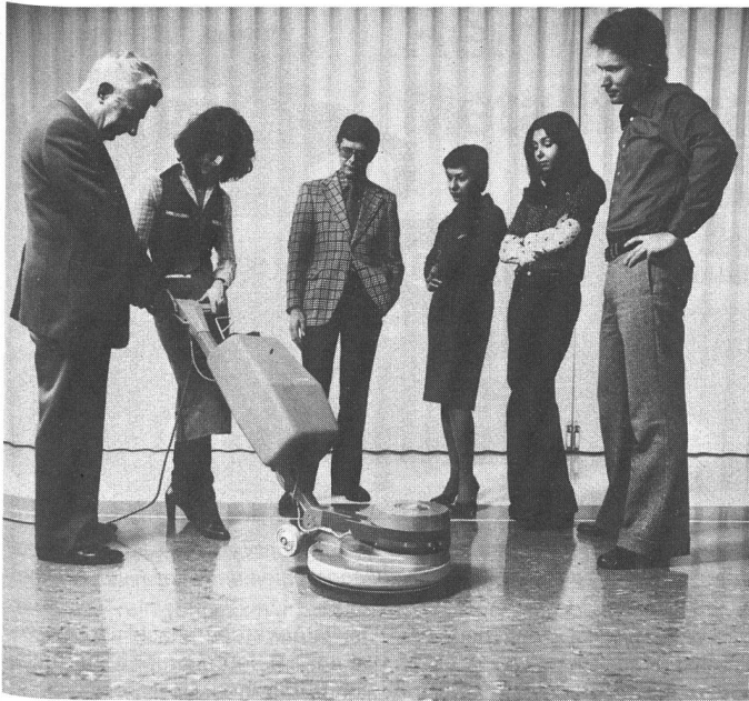
Instruktion des Reinigungspersonals.

als namhafte Zulieferfirma, instruiert daher das Personal nicht nur am jeweiligen Arbeitsplatz, sondern führt in ihren Kurszentren in Rümlang und Lausanne auch verschiedene Reinigungskurse sowohl für ausführendes Personal als auch für Kaderleute wie Equipenleiter, Einkäufer, Bauherren, Architekten durch.