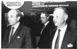
Eröffnung der Entsorga 80 in Essen durch den Bundeswirtschaftsminister Otto Graf Lambsdorff (links im Bild), zusammen mit dem Bürgermeister der Stadt Essen.