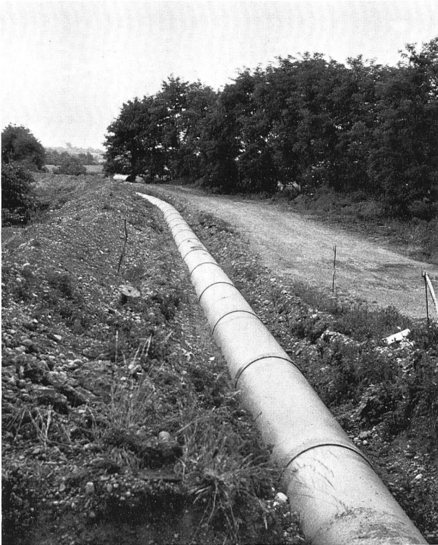
Druckleitung \varnothing 1000 mm, PN 4