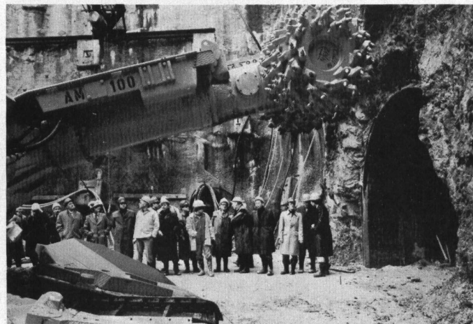
Milchbuckeltunnel: AM 100 im Einsatz.

Schneidkopfmachine und die nachgeschalteten Fördereinrichtungen optimal ausgenutzt werden können. Der AM 100 hat die Fähigkeit, grosse Streckenprofile bis zu 38 (48) m 2 von einem Standort aus zu schrämen. Die Maschine ist mit zwei 225 kW-Elektromotoren ausgerüstet.