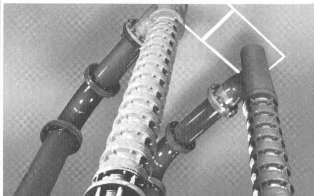
... Biral-Bohrlochpumpen aus der Schweiz

Für die Wasserversorgung und Trinkwasseraufbereitung . . .