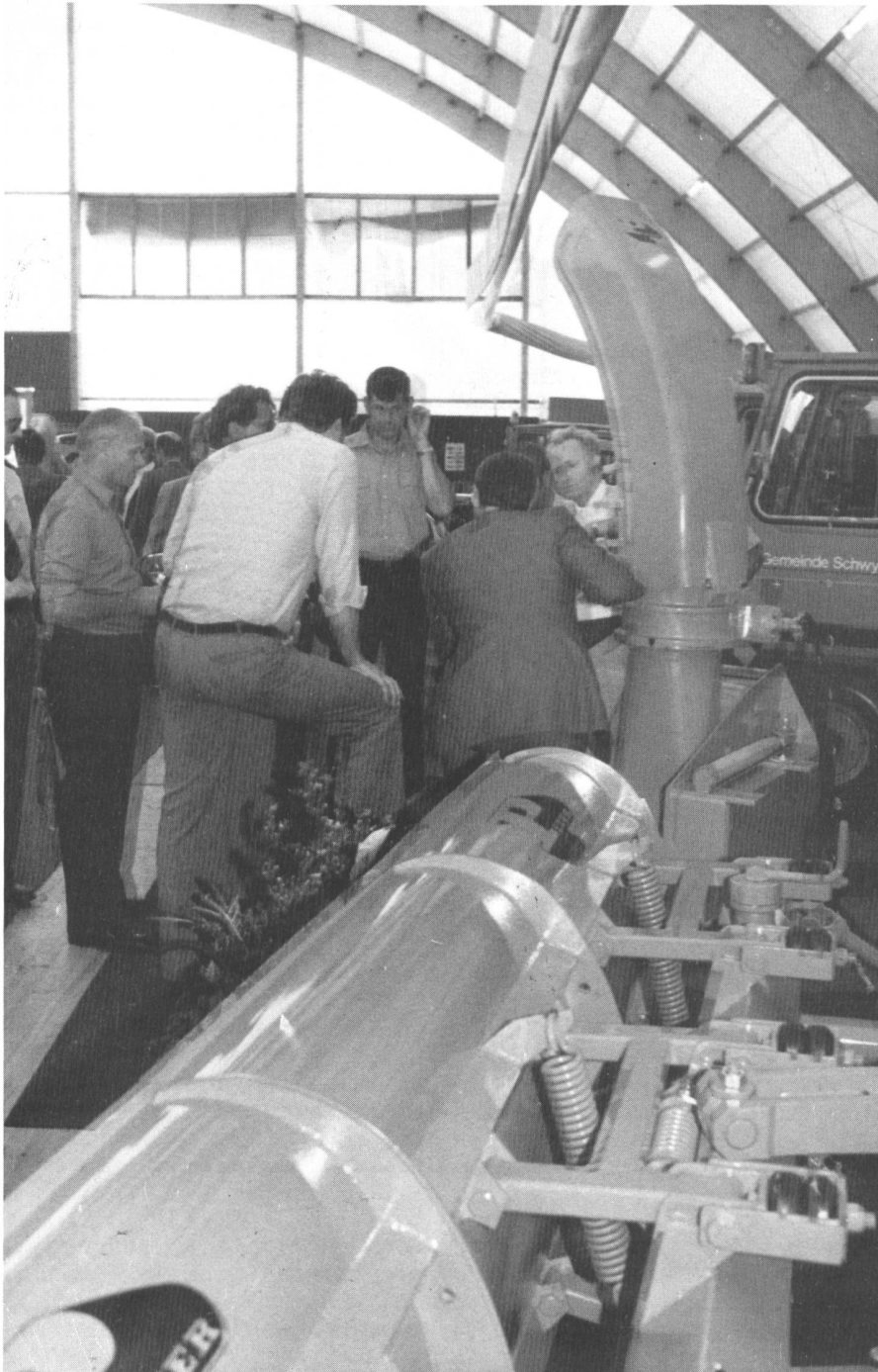
Für den Unternehmer recht ungewöhnlich: Bei Gemeinden werden Entscheide selten von nur einer Person getroffen.

Dem muss durchaus nicht so sein. Im Gegenteil, gerade die Tatsache, dass relativ viele Leute an einem Entscheid beteiligt sind, kann grosse Vorteile haben. Die Beschlüsse sind dann meistens gut abgestützt und schaffen nachträglich kaum Probleme. Es kommt doch eigentlich eher selten vor, dass eine Gemeinde nach Abschluss eines Geschäftes den Lieferanten oder Unternehmer aus irgendeinem Grunde einklagen muss. Dies spricht sicher für die Art und Weise, wie in unseren Gemeinden vorgegangen wird. Was lange dauert, wird auch lange währen. Und dies dürfte auch dem Lieferanten und Unternehmer zugute kommen.