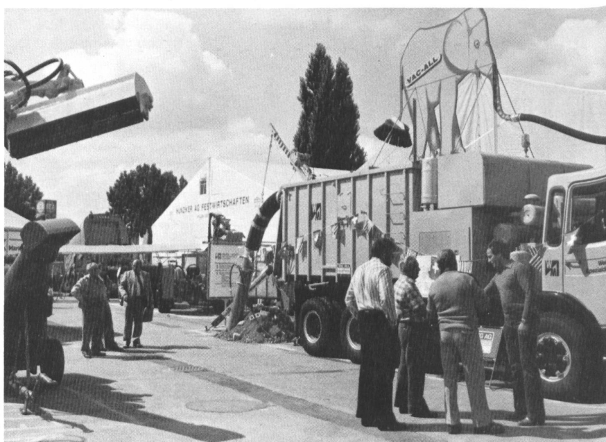
Die «Gemeinde» in Bern bietet den Behördevertretern gute Vergleichsmöglichkeiten.

Grundsätzlich kann davon ausgegangen werden, dass auch in Zeiten veränderter Wirtschaftslage die eingangs skizzierte Submissionsordnung Gültigkeit hat. Eine dieser Praxisänderungen würden ein Abweichen vom Prinzip der freien Marktwirtschaft bedeuten.