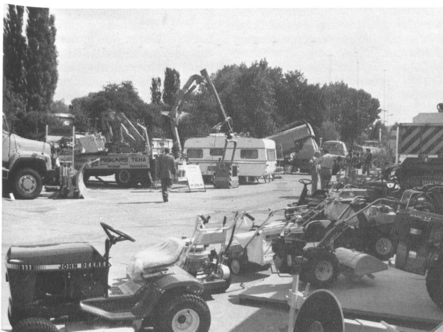
Die Gemeinden sind wichtige Kunden für die Privatwirtschaft.

Die Abweichung vom Prinzip des Wettbewerbs sollte nur so weit erfolgen, als dies aus wirtschaftlichen oder ausserwirtschaftlichen Gründen absolut unerlässlich erscheint. Schutz des einheimischen Gewerbes, die Gefährdung des Arbeitsplatzes oder die Schaffung neuer Ausbildungs- und Arbeitsplätze können Ausnahmegründe sein, die bei der Vergabe von Arbeiten oder Lieferaufträgen mitberücksichtigt werden können. Zu dieser Feststellung kommt auch ein Bericht der Kartellkommission aus dem Jahr 1967.