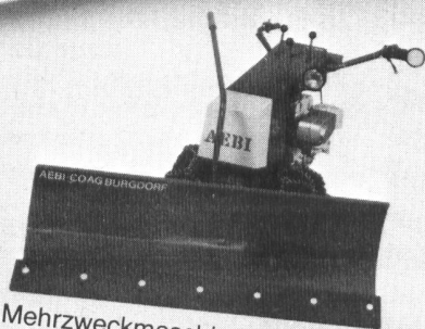
Mehrweckmaschine AEBI KM51