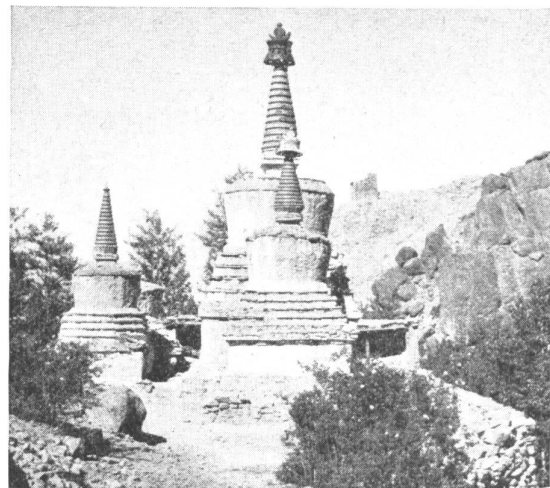
Bild 5: Tschörten in der Nähe von Hemis.

So soll Antilopenhorn bei Fieber und Durchfall helfen, vom Moschus wird gesagt, daß er Verstopfung heile, Bärengalle soll blutstillende Wirkung haben, Hammelhirn Schwindelgefühl beseitigen. Von den mineralischen Stoffen stehen wohl Quecksilber und Gold obenan. Ersteres wurde schon von jeher zur Behandlung von Lues angewendet, wie übrigens auch in Indien, Gold, in Form von Staub oder Blattgold gegen Lungen- und Herzleiden. Nicht minder überrascht auch die Anwendung von allerhand Mineralien und Edelsteinen (Lapislazuli, Achat, Türkis, Rubin, Saphir usw.), Korallen, Bernstein und selbst Perlen. Die teuren, schwer zu beschaffenden Heilmittel werden, wie nicht anders zu erwarten, auch als die wirksamsten angesehen.