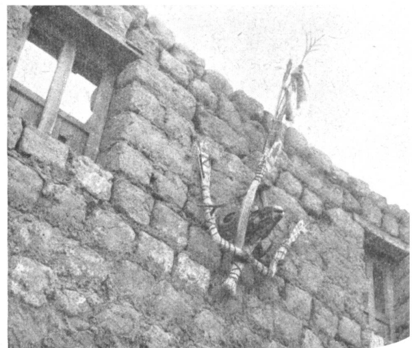
Bild 2: Widderschädel mit Strofigur und Fadenkreuzen zur Beschwörung und Abwehr der Erdgeister an der Wand eines Wohnhauses in der Nähe von Leh.

Die tibetisch-buddhistische Glaubensformel, «Om mani padme hum», ist übrigens nicht bloß das bekannteste und meistgesprochene Gebet, sondern zugleich eine Formel, die die bösen Gei-