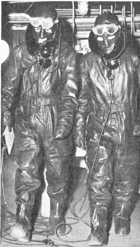
Bild 6: Mitglieder einer Höhen-Test-Mannschaft in voller Ausrüstung sehen oft aus wie Erscheinungen aus einer anderen Welt. Fliegerhauben, Schutzbrillen, Sauerstoff-Masken und die schwere, elektrisch geheizte oder pelzgefütterte Kleidung verbergen Gestalt und Gesicht der Männer, und man glaubt es kaum, daß sie, derart behindert, längere Zeit sorgfältige Beobachtungen machen und aufs engste mit den anderen Mitgliedern der Mannschaft zusammenarbeiten können. Der kleinste Fehler kann die Arbeit von Wochen zunichte machen oder sogar das Flugzeug und das Leben aller gefährden.