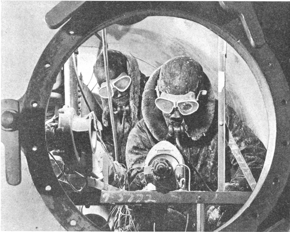
Bild 1: Blick durch das Fenster des Kühlraumes, wo unter ständiger Kontrolle von Ingenieuren, die sich ebenfalls niederen Temperaturen aussetzen müssen, Flugzeugteile geprüft werden. Im Innern dieser Kälteanlage herrschen Temperaturen bis zu 62° C unter Null.

Immer eindeutiger zeigt es sich, daß der zukünftige Fernluftverkehr in den luftverdünnten, verhältnismäßig ruhigen Luftschichten der Substratosphäre und der Stratosphäre stattfinden wird. Die Flugzeugindustrie, die um Jahre voraus planen muß, hat deshalb bereits Versuche mit Flugzeugen unternommen, die ohne jede Behinderung in diesen Höhen verkehren können. Es hat sich dabei gezeigt, daß bei diesen Flughöhen oft lebenswichtige Teile des Flugzeuges nicht mehr zuverlässig arbeiten oder sogar vollständig versagen. Die Kälte, die oft bis auf -62^{\circ} Celsius und darunter sinkt, bewirkt, daß Gummi brüchig und hart wie Glas wird und tatsächlich einfriert.