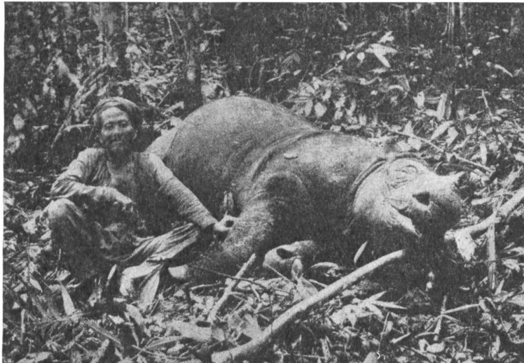
Bilder 1 und 2: Von einem Eingeborenen erbeutetes Sumatranisches Nashorn.

Hätte man nicht diese beiden Tierschutzreservate geschaffen, so wäre das Nashorn auch dort bereits verschwunden.