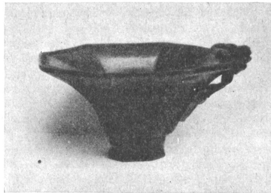
Bilder 3-5: Becher aus Rhinozeroshorn, aus Kanton (China), jetzt im Museum für Völkerkunde, Basel.