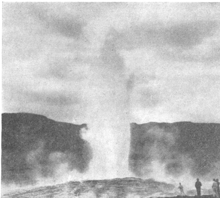
Bild 1: Der «Store Geysir», das heißt der Große Geysir, ist Islands größte Warmwasserquelle, ein Springbrunnen von 20 bis 30 Metern Höhe. Seine Ausbrüche sind unregelmäßig und werden zur Zeit noch nicht verwertet.

Eine systematische Untersuchung der Quellen fand im zweiten Jahrzehnt unseres