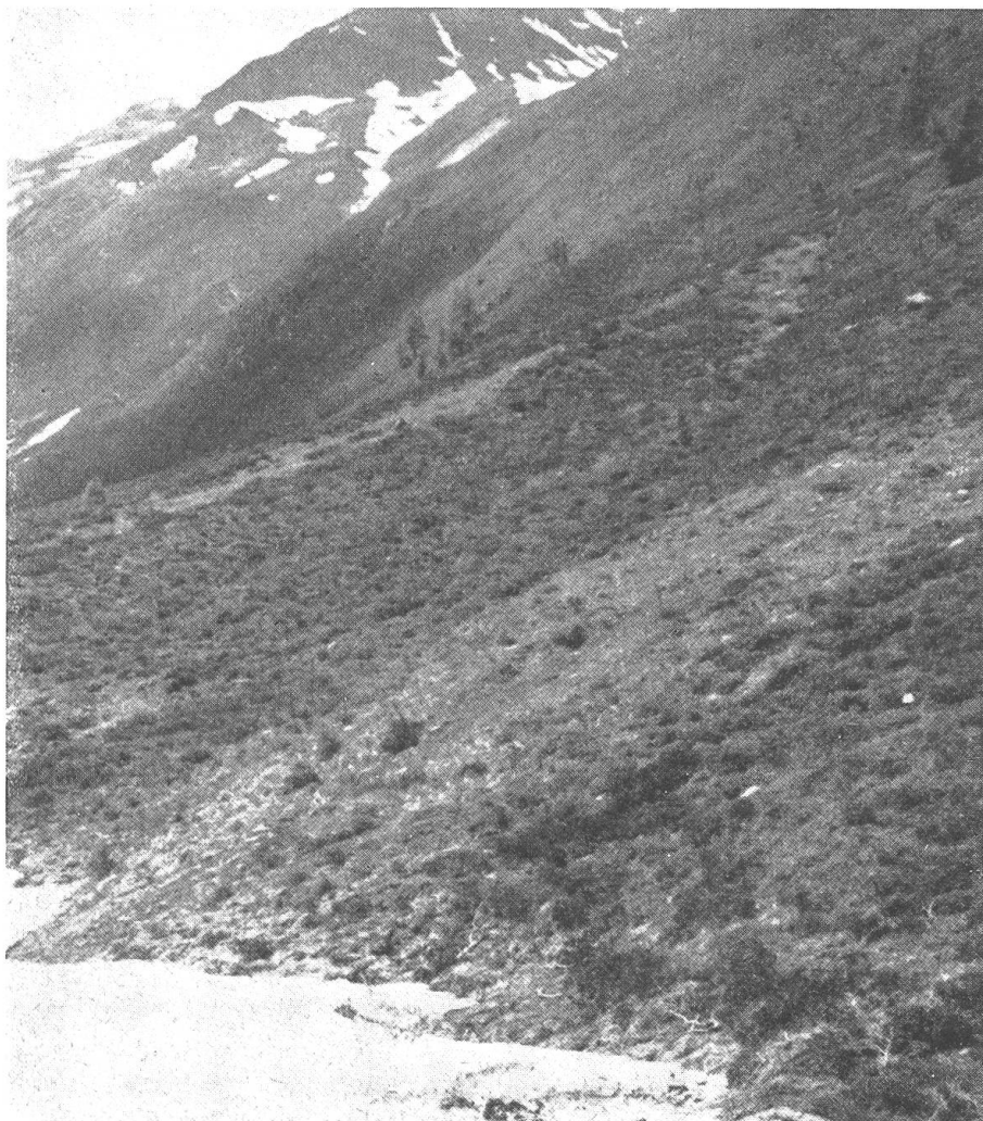
Abb. 4. Eine Hochalm im Defreggental (Osttirol). Dieses Bild zeigt deutlich, wie hier durch Überhandnehmen der Alpenrosen jeder üppige Graswuchs unterbunden wird

Kaine der Roggenfelder und bietet einem pilzlichen Parasiten des Getreides, dem Getreiderost ( Puccinia graminis ), eine willkommene Gelegenheit der Überwinterung. Dieser Pilz, welcher sich während der Vegetationsperiode des Getreides an den Halmen festsetzt, wird mit Eintreten der Roggenernte obdachlos. Die Sporen werden vom Wind auf die benachbarte Berberitze übertragen und überdauern dort — gut geschützt — den Winter. Auch hier wurde der Versuch unternommen, durch Bespritzung der Berberitzensträucher mit Dicopur Abhilfe zu schaffen. Diese Versuche sind noch nicht abgeschlossen, doch zeigt sich schon jetzt, daß die Berberitze schwer geschädigt wird. Durch diese Maßnahme wird dem Pilz die Überwinterungsmöglichkeit genommen, und die Roggenfelder des Lungau werden, wenn die Bekämpfung der Berberitze vollständig gelöst sein wird, wieder vollwertige Ernten bringen.