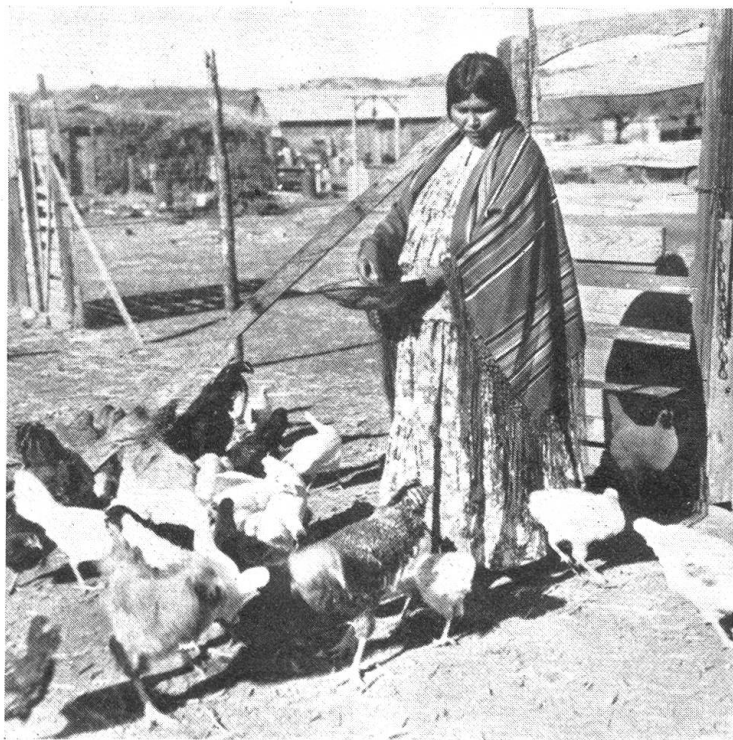
Der überwiegende Teil der noch heute lebenden Indianer ist in der Landwirtschaft tätig. Sofern sie nicht in Reservationen Ackerbau und Viehzucht betreiben, sind ihre Farmen in fast allen Staaten verteilt. Eine Apachenfrau füttert die Hühner auf ihrer Farm in Arizona

ein weites Waldgebiet, dessen Flüsse und Seen sie mit ihren leichten Kanoes befuhren. In ihre Jagdgründe drangen von Süden her, lange bevor die Europäer den Kontinent betraten, eine Anzahl besonders kriegerischer und wegen ihrer Grausamkeit gefürchteter Stämme ein — die I r o k e s e n . Diese