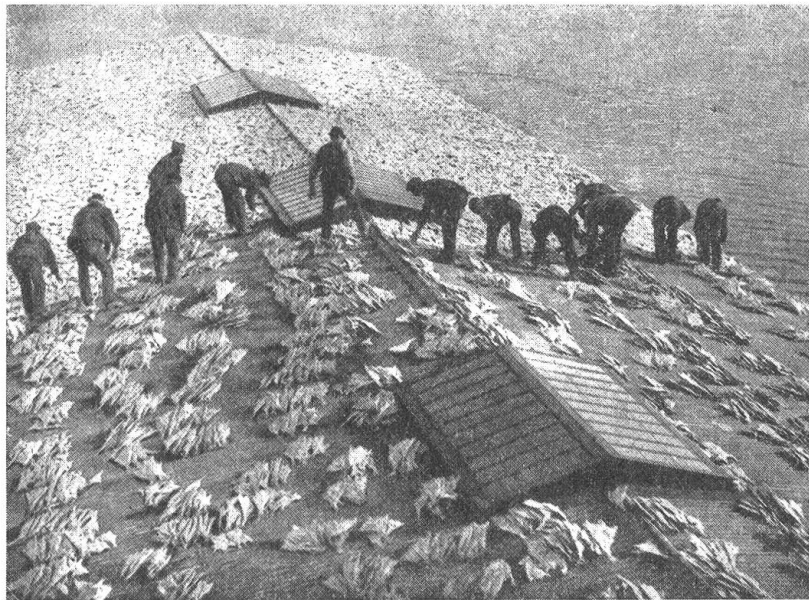
Das Trocknen von Kabeljaus auf dem Deck eines Fischdampfers

des Weißen Meeres. Nach Süden reicht ihr Lebensgebiet bis an die Küsten Englands und Irlands, sie bevölkern die Nordsee und die Ostsee; und überall sind sie — zum Teil seit Jahrhunderten — Gegenstand blühender Fischerei, die Tausenden und aber Tausenden Lebensunterhalt, ja Lebensgrundlage gegeben hat und gibt. Alljährlich birgt sie viele Hunderte von Millionen Kilogramm Fischfleisch aus dem Meere und daneben den heilkräftigen Lebertran, der ja vor allem aus den Lebern von Kabeljau und Schellfisch — daher die medizinische Bezeichnung „oleum jecoris aselli“ — gewonnen wird. Die alte Neufundland- und die Islandfischerei nicht weniger wie die an den Küsten Norwegens haben weltweite Bedeutung erlangt. Und jeder, der einmal die Gelegenheit hatte, längs der malerischen Küste Norwegens nach Norden zu fahren, wird sich auch der vielen, vielen Plätze erinnern, an denen die Felsen der Schären und des Festlandes bedeckt waren mit den weißlichen gespaltenen Körpern dieser Fangbeuten oder wo sich auf lange Strecken die Gestelle erhoben, an denen sie zur Trocknung leise im Winde baumelten.