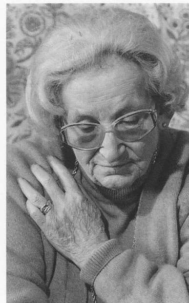
L'argent suffira-t-il à couvrir mes frais de pension ?