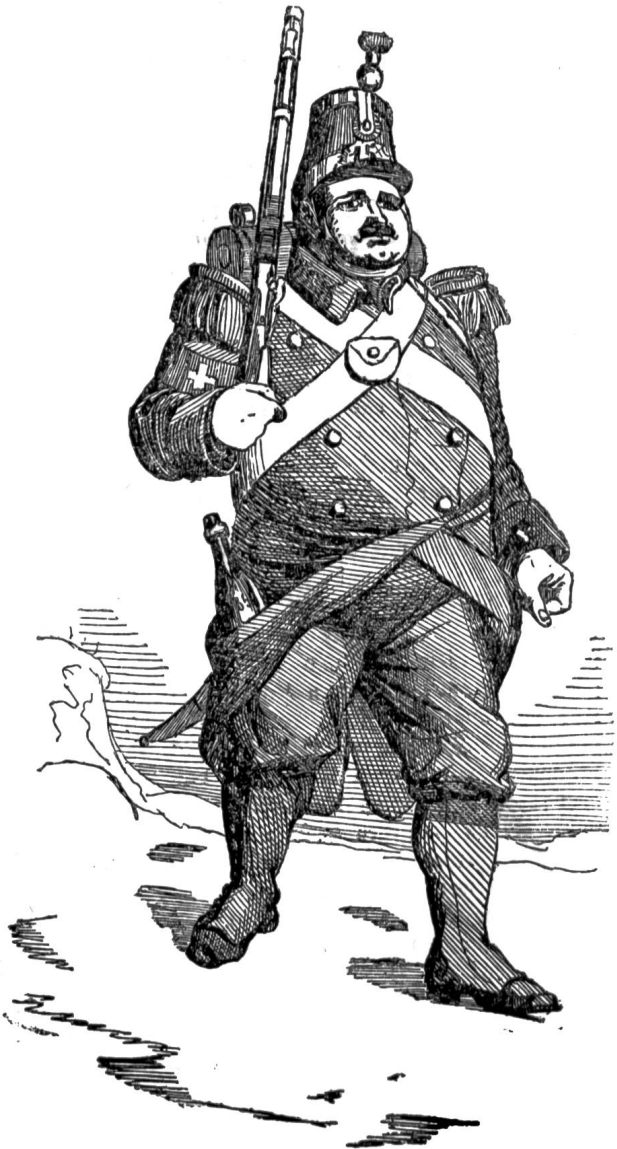
wieder heim kommt.