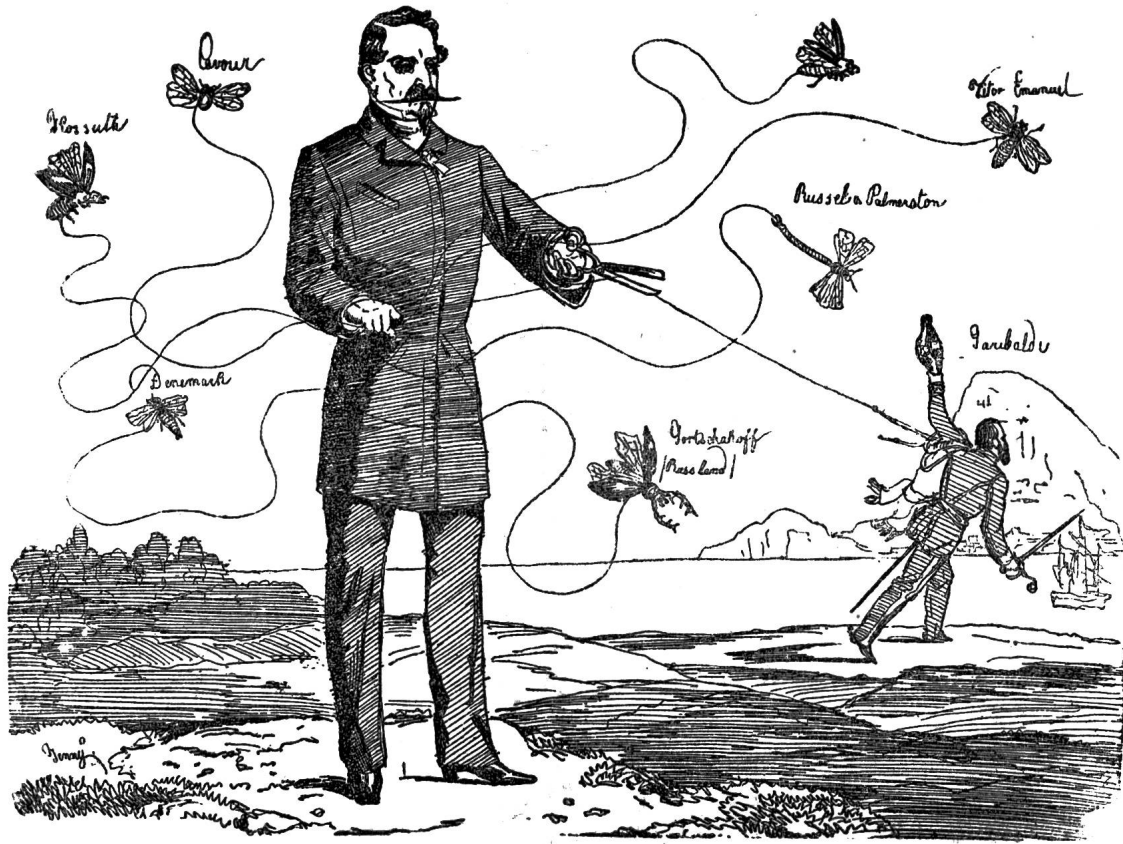
Er hält die Fäden der europäischen Politik in Händen.