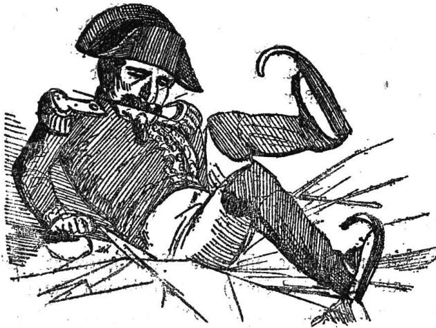
(Der Kaiser wird an dem fernern Genuß seines Lieblingsvergnügens verhindert.)