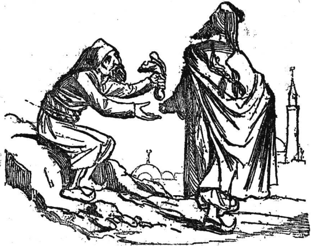
(Den Bemühungen des Finanzministers zum Trost ist das türkische Anleihen zur Stunde noch nicht ganz gedeckt.)