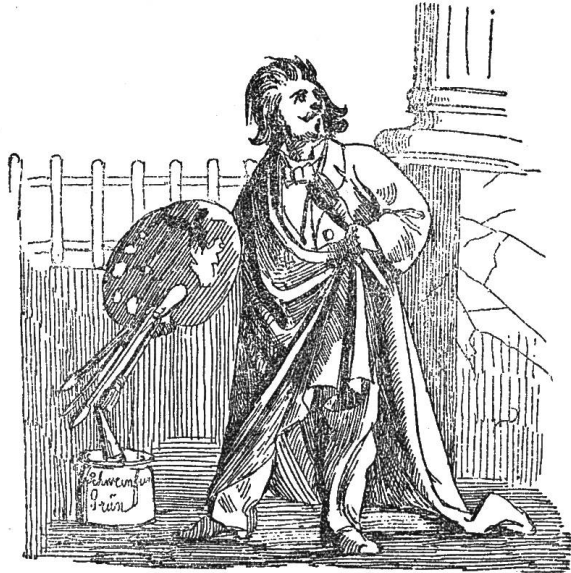
Schihl, der Gartenhaagmaler.