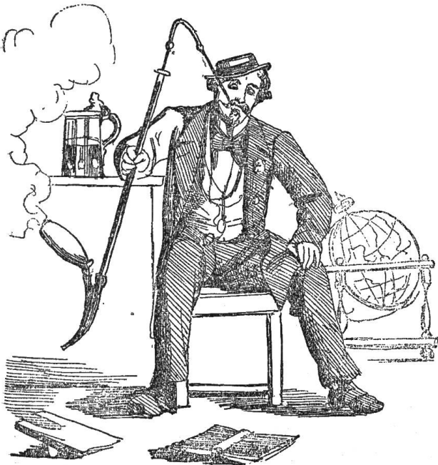
Der Weltverbesserer Gusebio.