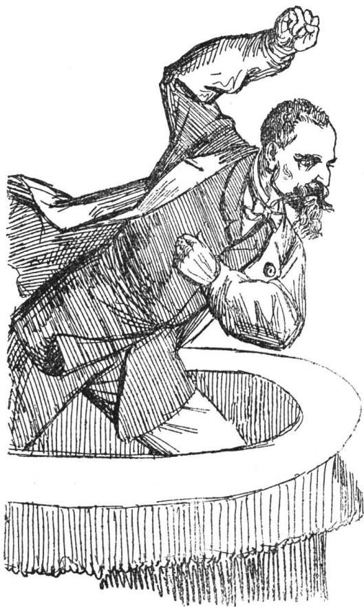
I. Der französische Marktreddner. Orator furibundocharlatan gallicus.