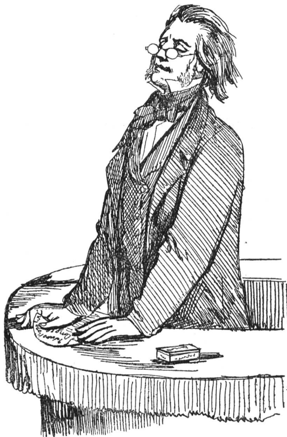
II. Der deutsche Paulskirchenredner. Orator professorecathedricus. germanicus.