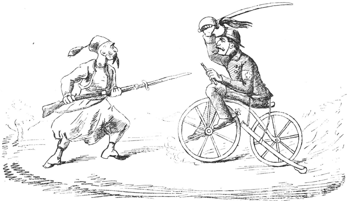
Dragoner im Gefecht.