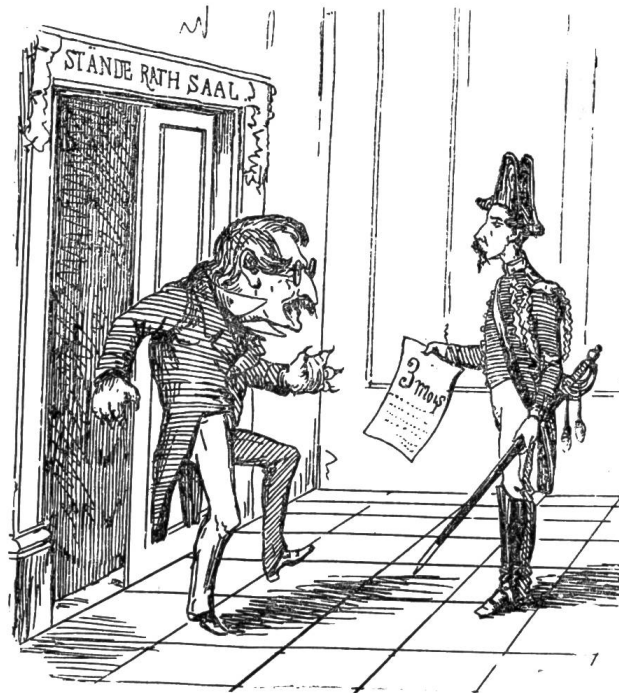
Plait-il, mon cher?