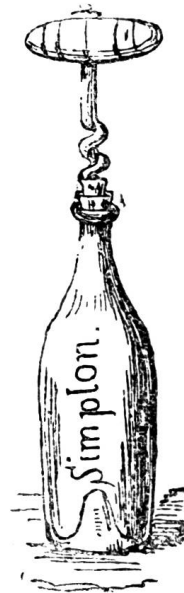
Tunnelbohrer, womit Lavallette den Simplon zu durchstechen gedenkt.