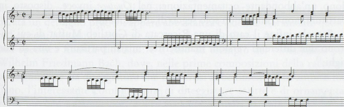
Esempio 4b: La Gratirosa

Forse sarebbe interessante riproporre più frequentemente il repertorio seicentesco italiano di canzoni e ricercari dando vivacità all'esecuzione più che con la velocità del tempo, con l'aggiunta «di quei garbi e quelli accenti che detta musica ricerca». 12 Se poi si volesse scegliere per le canzoni un tempo più vivace, non si dovrebbero comunque tralasciare di introdurre almeno «tremoli, & groppi».