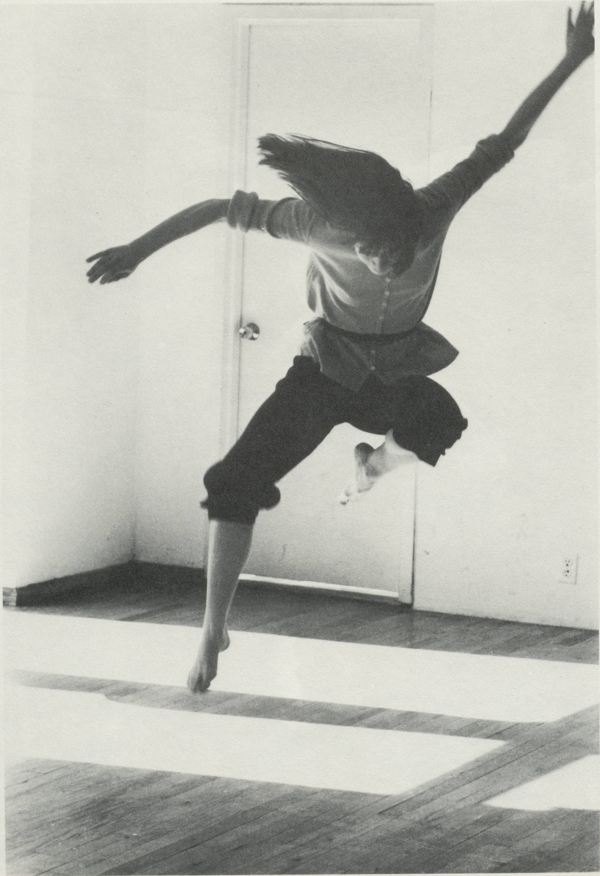
«Journey for Tao Sides: A Solo Dance Duets», 1978