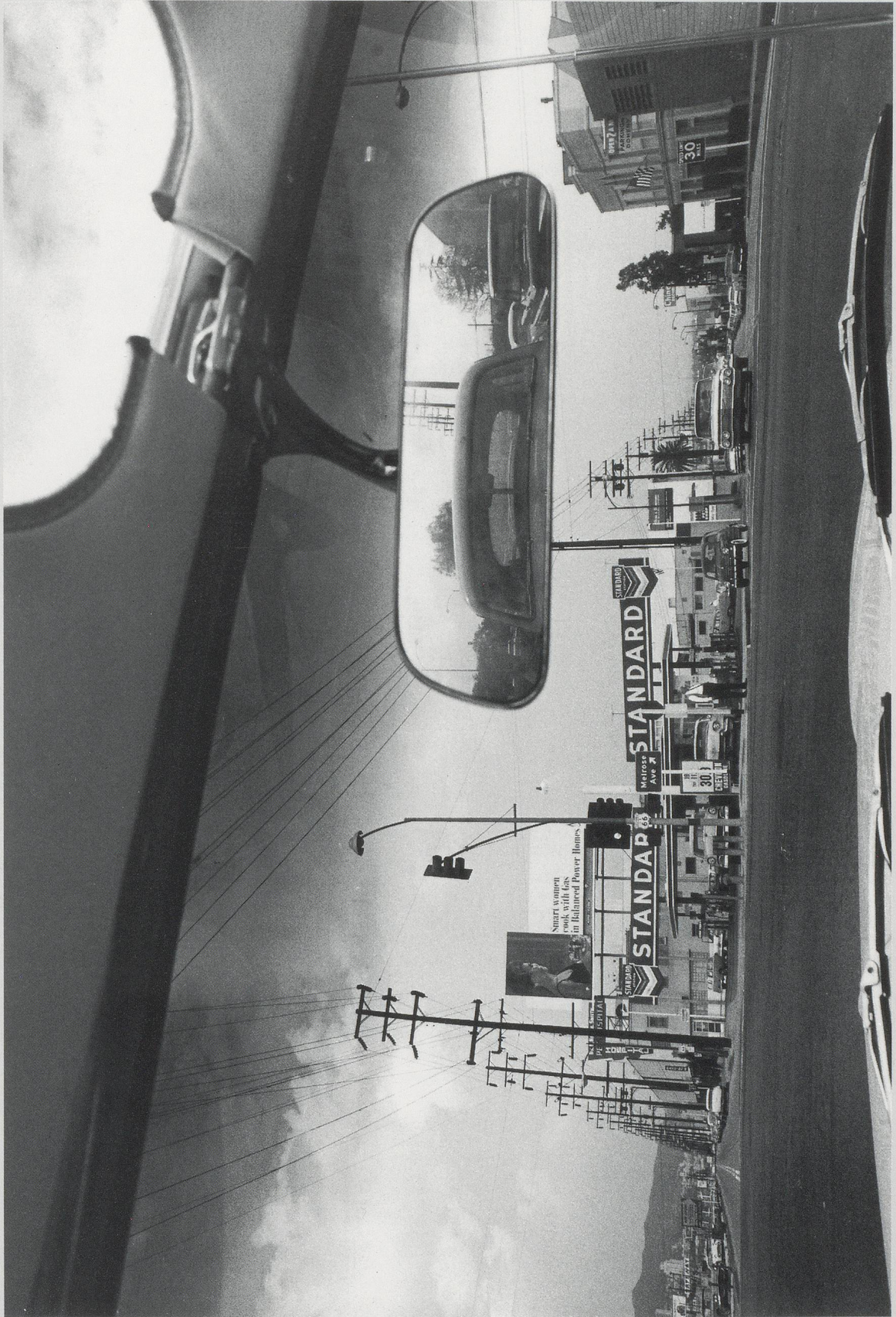
DENNIS HOPPER, DOUBLE STANDARD, 1961