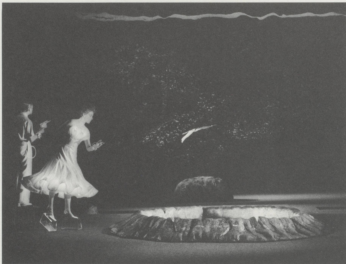
ROBERT WILSON, DEATH DESTRUCTION AND DETROIT, SCHAUBÜHNE BERLIN, 1979.