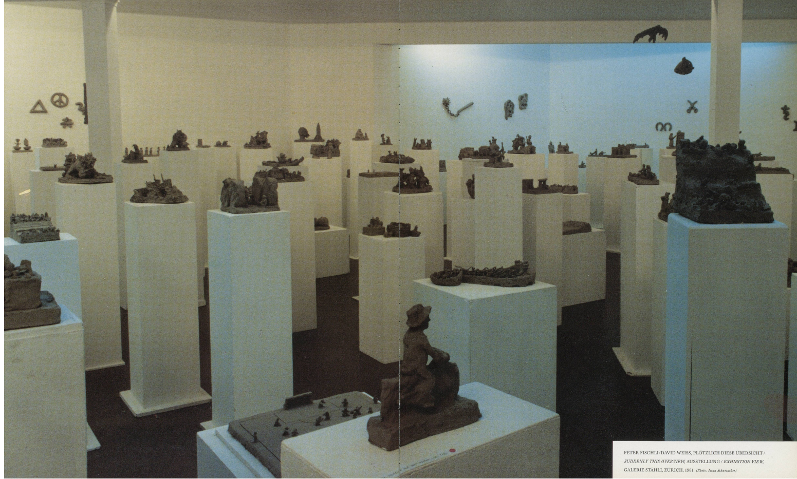
PETER FISCHLI/DAVID WEISS, PLÖTZLICH DIESE ÜBERSICHT / SUDDENLY THIS OVERVIEW, AUSSTELLUNG / EXHIBITION VIEW, GALERIE STAHL, ZÜRICH, 1981.