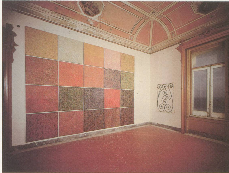
PHILIP TAAFFE, IL TERRAZZO, 1988, mixed media, 128 1/2 x 160 1/2" / 326 x 408 cm.

Schutzheiligen der Stadt zu werden. Taaffes Hommage erinnert sowohl an die virilen Elemente der Sage als auch an jene der Seefahrt, jedoch ohne Pathos. Oder er versetzt uns in das rote Innere des Vesuvs; was zunächst danach aussieht, als sei Expressionistisches «eingeschmolzen» worden, stellt sich als eine glänzende, straff angeordnete Fläche heftig wogender Figuren heraus, die kaum noch erkennbar