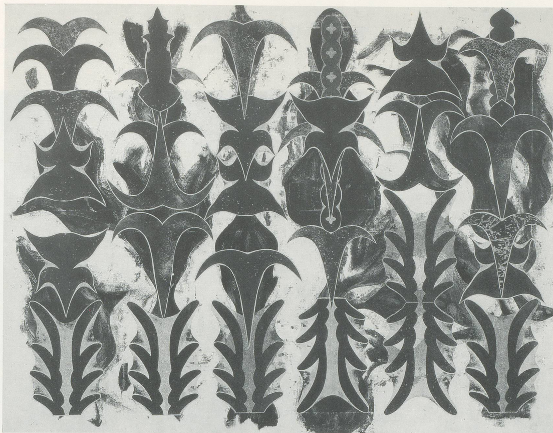
PHILIP TAAFFE, DESERT FLOWERS , 1990,

mixed media on linen, 61 1/4 x 79" / WÜSTEN BLUMEN, 1990, 155,5 x 200,5 cm.