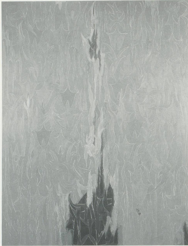
PHILIP TAAFFE, QUADRO VESUVIANO, 1988, monoprint, acrylic on linen, 89 x 68 1/2" / Monotypie, Acryl auf Leinwand, 226 x 174 cm.

ranean siroccos, shifting Arabian sands, and confectioned African scents that linger with the science long after its journey. Hence, in works like SCREEN WITH DOUBLE LAMBREQUIN , OLD CAIRO , and BANDED ENCLOSURE , we find architectonic and organic motifs teeming with the life-force and space-time of Islamic, Coptic, Turkish, and Armenian essence.