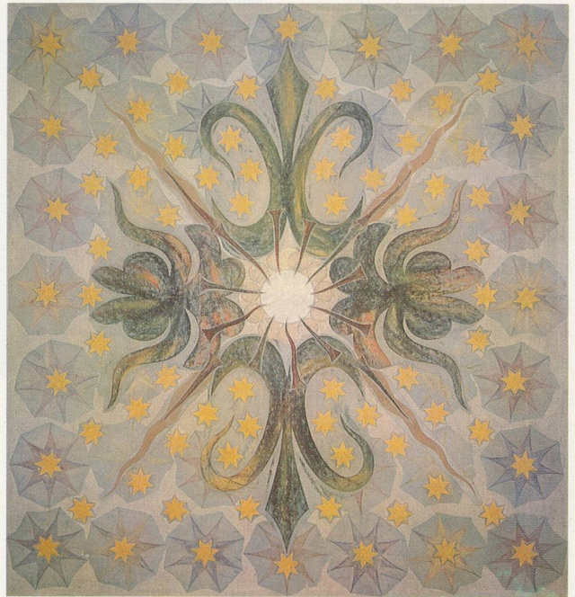
PHILIP TAATFFE, CEREMONIAL ABSTRACTION, 1988, monoprint, acrylic on linen, 37 1/2 x 39 1/4" / ZEREMONIELLE ABSTRAKTION, 1988, Monotypie, Acryl auf Leinwand, 95,3 x 99,7cm.

Da sich wenige Künstler der Geschichte von Ideen verschreiben, lässt Taaffes jüngste Wendung sich vielleicht aus seiner Übersiedlung nach Neapel erklären. Ganz sicher erklärt sie seine gesteigerte Begeisterung am Augenschmaus, eine durchaus mutige Haltung in einem postmodernen Klima, das empathische Ästhetik einem logozentrischen Rationalismus opfert. In Bildern wie QUADRO VESUVIANO zum Beispiel erfüllt Taaffe die starre Ästhetik der Abstraktion mit der wilden Schönheit und dem Schrecken des lebendigen Kraters, der jahrtausende-