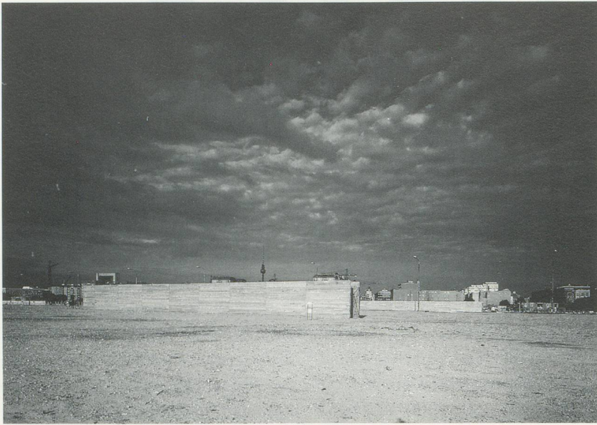
ILYA KABAKOV, ZWEIERINNERUNGEN AN DIE ANGST / TWO MEMORIES OF FEAR, POTSDAMER PLATZ, 1990.

die auch in ästhetischer Hinsicht eine Begegnung herstellt zwischen dem seelenlosen Materialismus der westlichen Wegwerfgesellschaft und der puren Not des materiell noch unterversorgten Ostens.