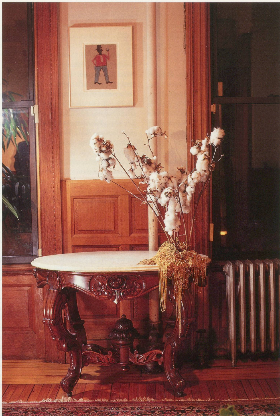
DAVID HAMMONS, FERTILIZER FOR THE WESTERN HARVEST, 1992, cotton flowers, gold chains/ DÜNGER FÜR WESTLICHE ERNTE, 1992, Baumwollzweige, Goldketten.