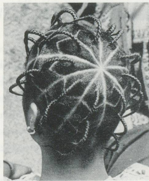
STAR SCALP DESIGN, Southern Nigeria/ STERNFÖRMIGE HAARMODELLIERUNG, Süd-Nigeria.

— DH: It was like I had wiped myself out. I'm still trying to recover from having had to recreate these pieces for the retrospective.