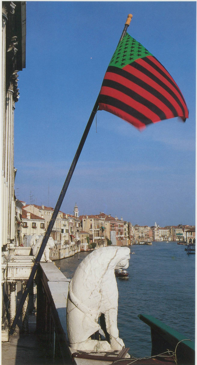
DAVID HAMMONS, AFRICAN-AMERICAN FLAG, Venice, 1990/AFRIKANISCH-AMERIKANISCHE FLAGGE, Venedig, 1990.