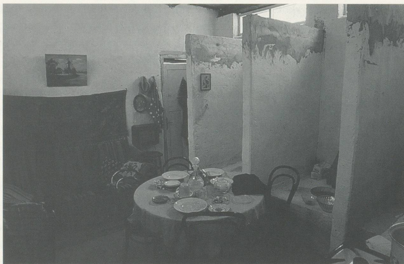
ILYA KABAKOV, DIE TOILETTE / THE TOILET. Installation documenta IX, 1992.