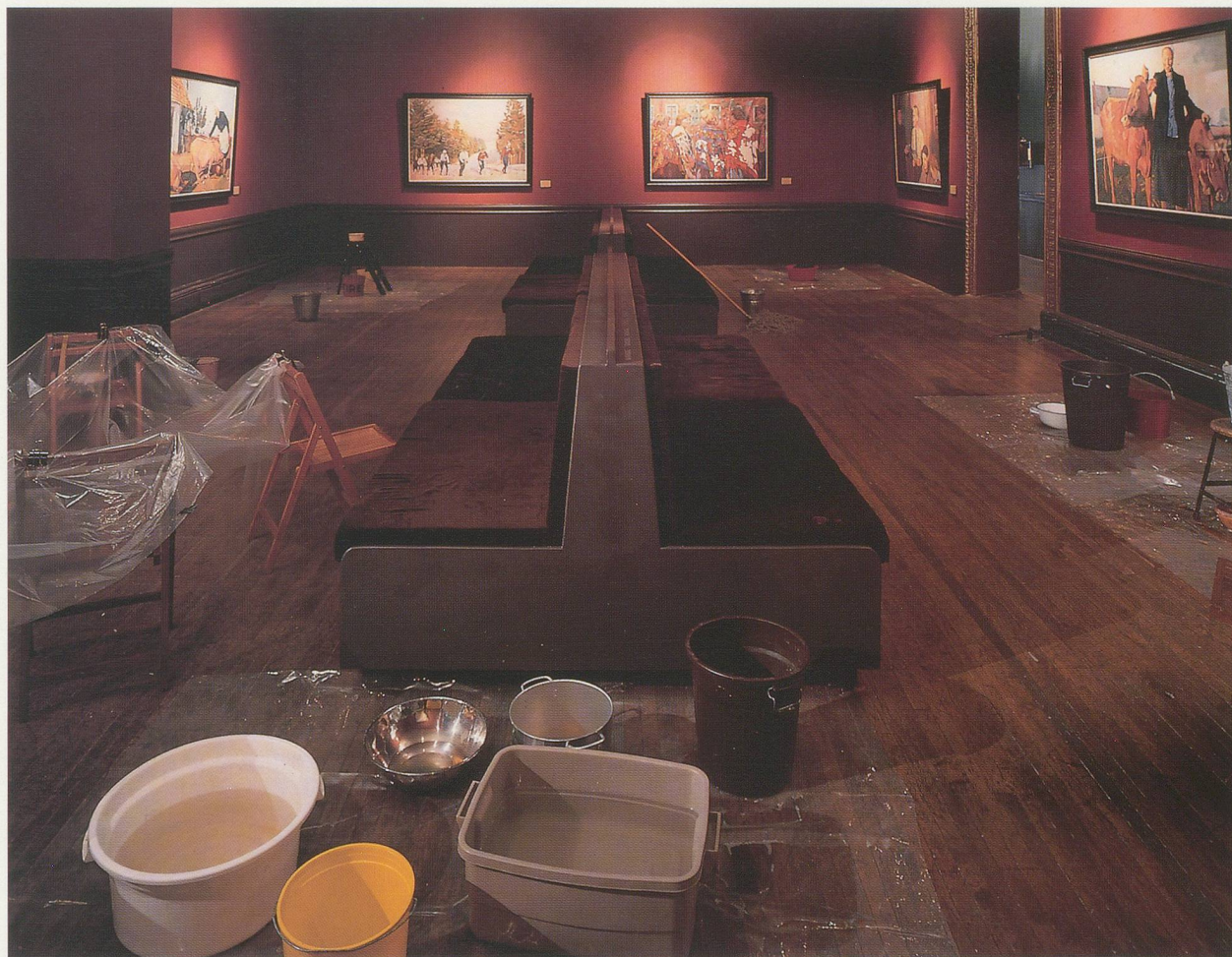
ILYA KABAKOV, INCIDENT AT THE MUSEUM OR WATER MUSIC / VORFALL IM MUSEUM ODER WASSERMUSIK, installation Ronald Feldman Gallery, New York, 1992.